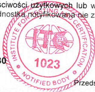
RNDr. Radomír ČEVELÍK Przedstawiciel jednostki notyfikowanej Nr 1023